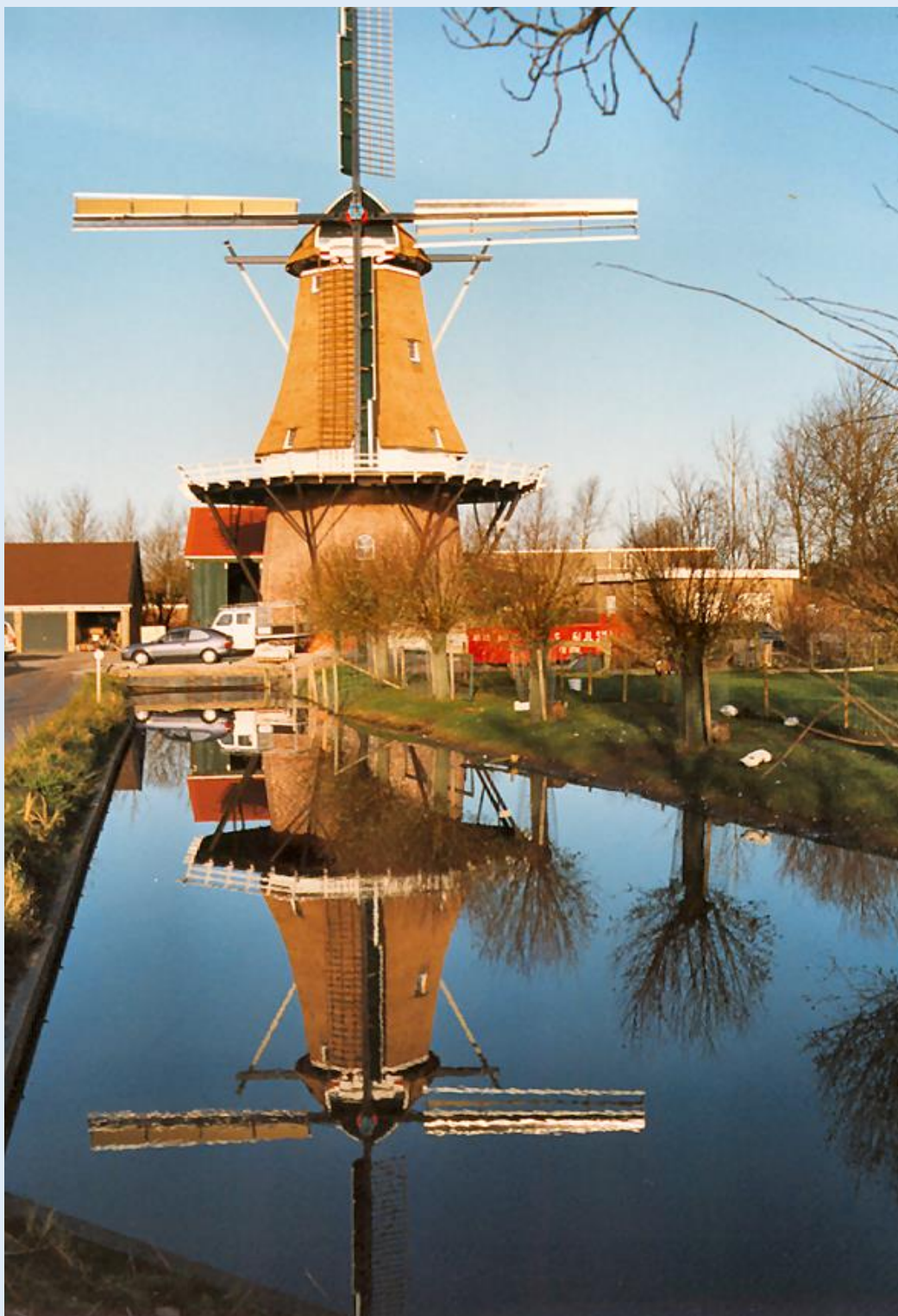
Molen De Hoop te Stiens

Deze kaart met 2 fietsroutes is samengesteld en uitgegeven door de Documentatiestichting Leeuwarderadeel met steun van de Gemeente Leeuwarderadeel