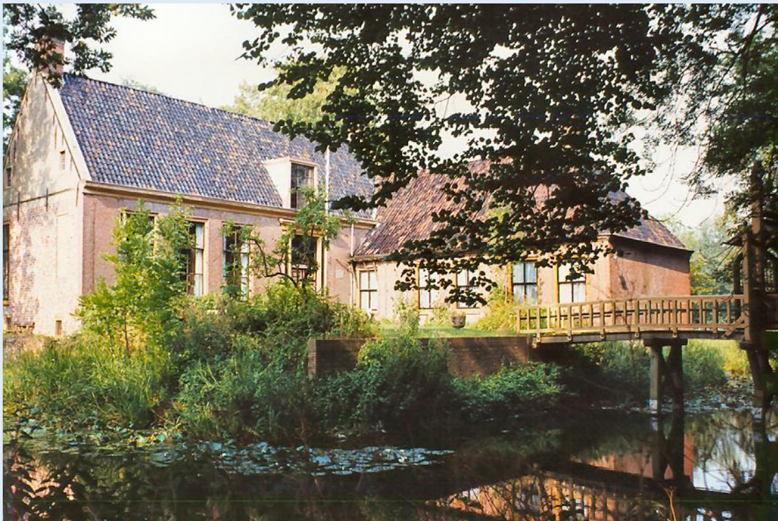
Dekema State te Jelsum