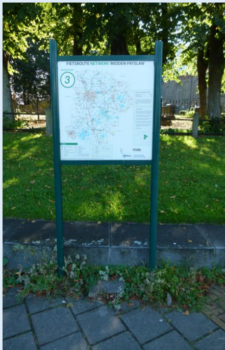
Start bij knooppunt 3