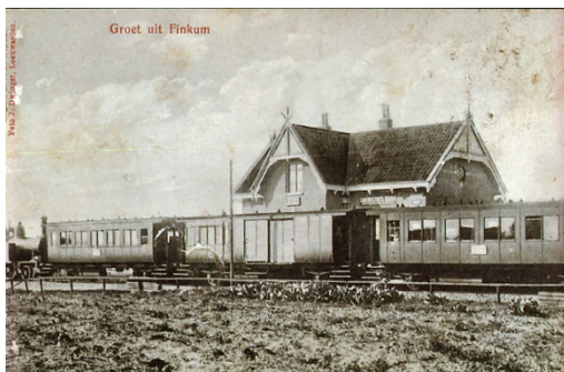
Station 3 e klasse in Feinum

Bij de bochten van Feinsumer Feart, die deel uitmaakt van de Noordelijke Elfstedenroute, ligt het dorp Feinum/ Finkum. De feart die het dorp met Aldelije en de Dokkumer Ee verbindt, is zo bochtig dat aangenomen wordt dat het een oorspronkelijke slenk van/ naar de Bordine/ Middelsee is geweest. Feinum is het kleinste dorp van de voormalige gemeente Leeuwarderadeel. Ondanks de bescheiden grootte heeft Feinum diverse voorzieningen, zoals een jachthaven en een grote speeltuin langs de plek waar vroeger een treinstationnetje 3 e klasse stond. Dit station werd in 1902 in gebruik genomen.